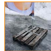
Kryssfot på pall