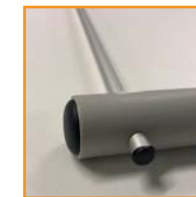
Event Sign Bar